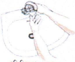
পানি দিয়ে হাত ভেজন

অ্যালকোহলযুক্ত স্যানিটাইজার দিয়ে হাত পরিষ্কার করুন (২০-৩০ সেকেন্ড)